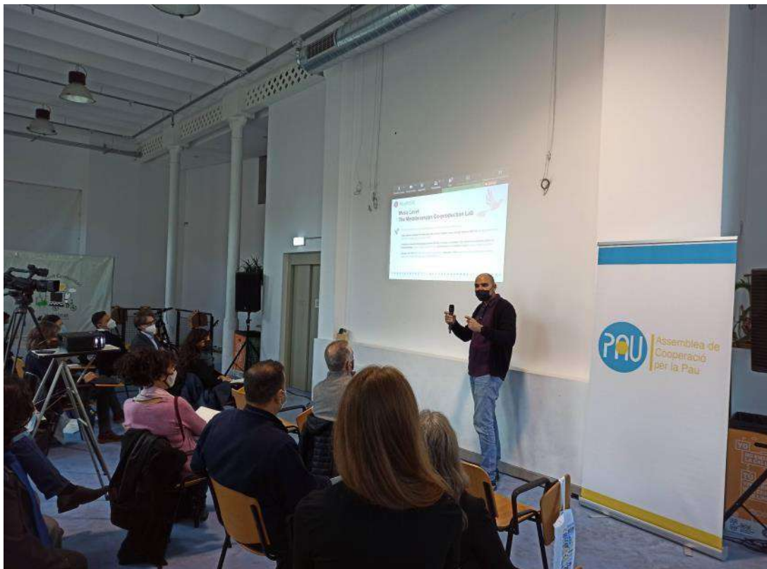
Assemblea de cooperació per la Pau, Projecte MedRISSE - 9 i 10 novembre 2021