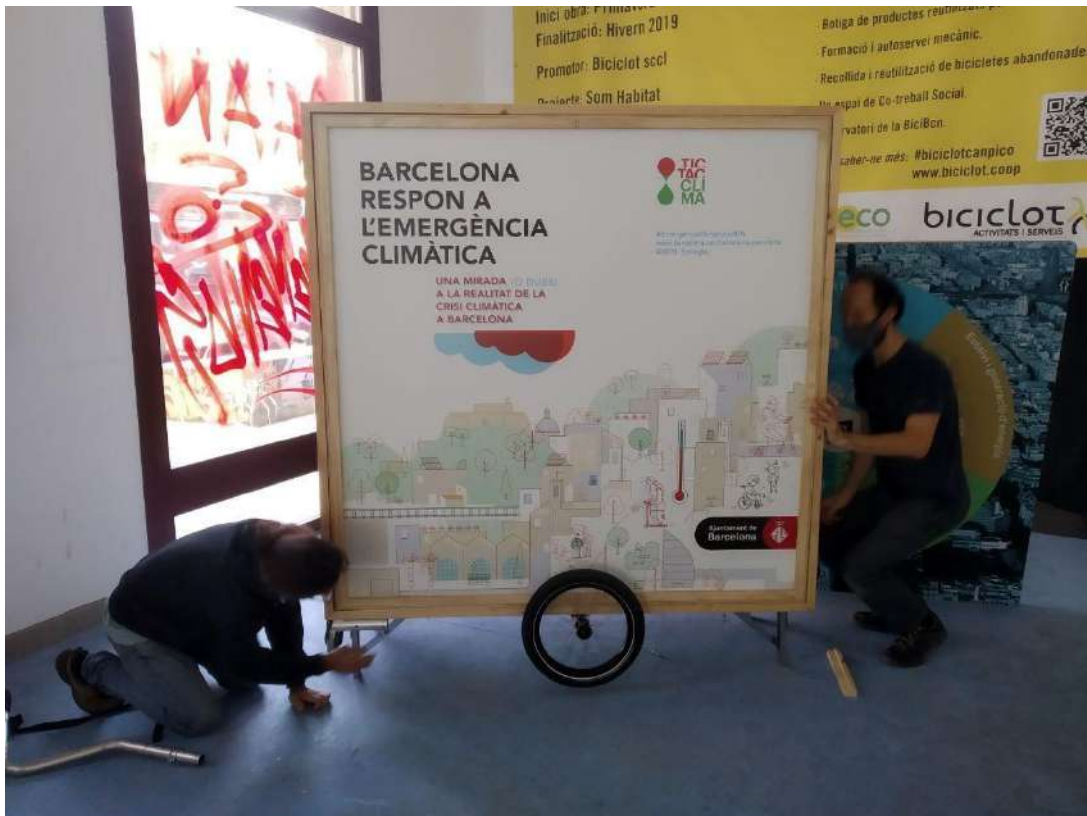
Muntatge de l'exposició Barcelona Respon a l'emergència climàtica - octubre 2021