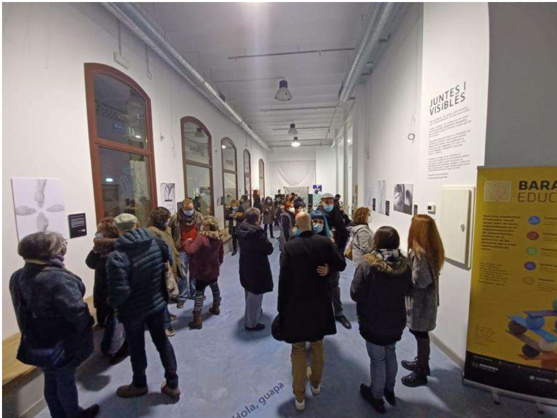
Inauguració de l'exposició Juntes i Visibles - 26 novembre 2021