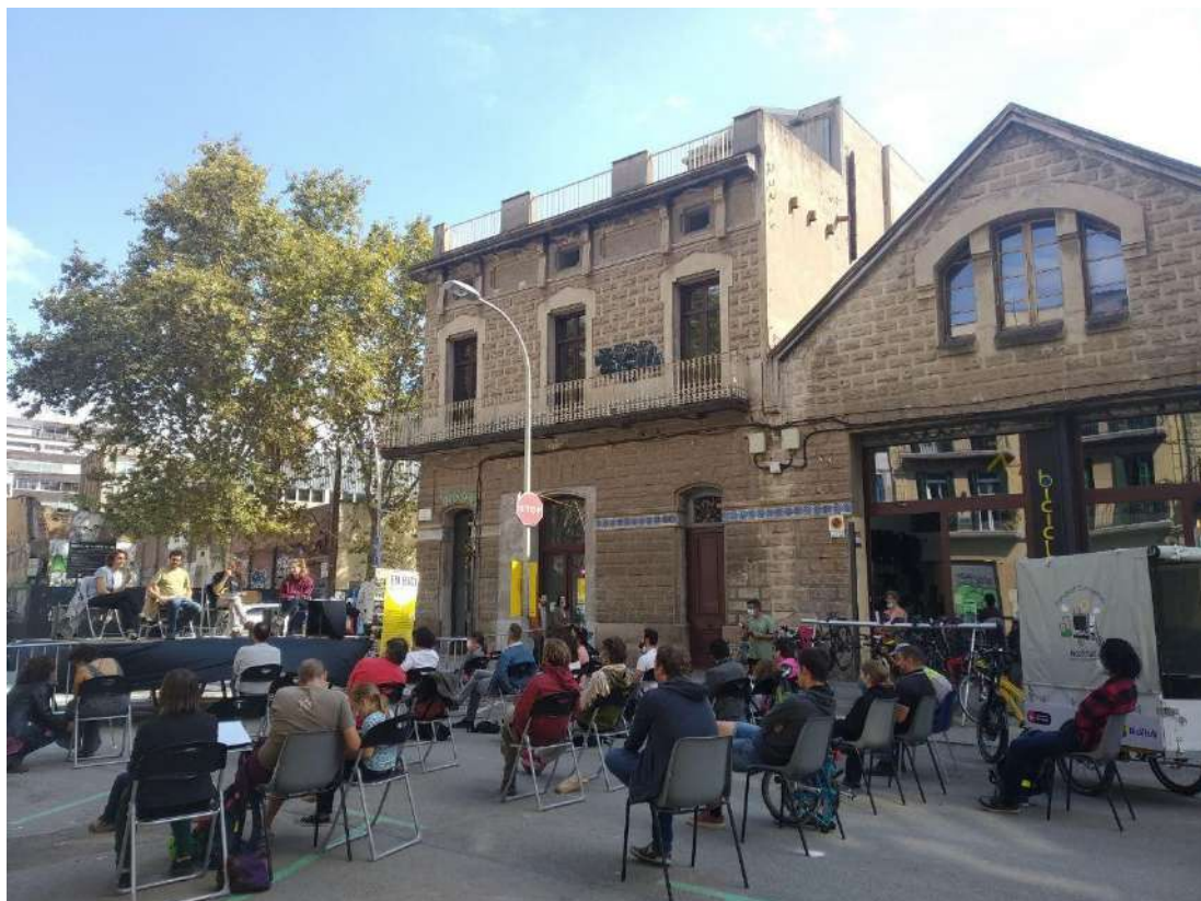
Congrés de la Bici: Activitats i experiències per pedalar la ciutat i el territori - 9 octubre 2021